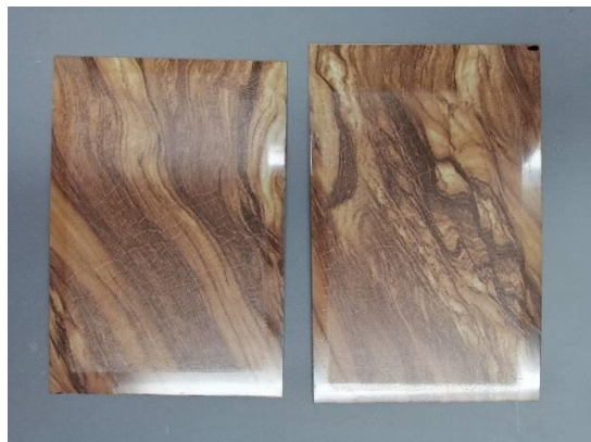
AW05 TT (screpolatura film trasparente)