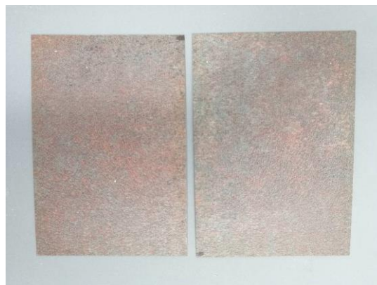
HS05 TO (aspetto superficiale ok)