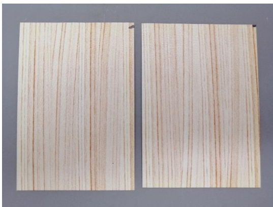
HW04 TO (aspetto superficiale ok)