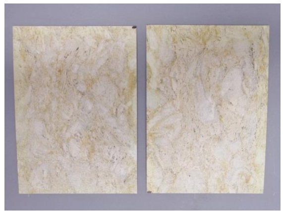
HS07 TO (aspetto superficiale ok)